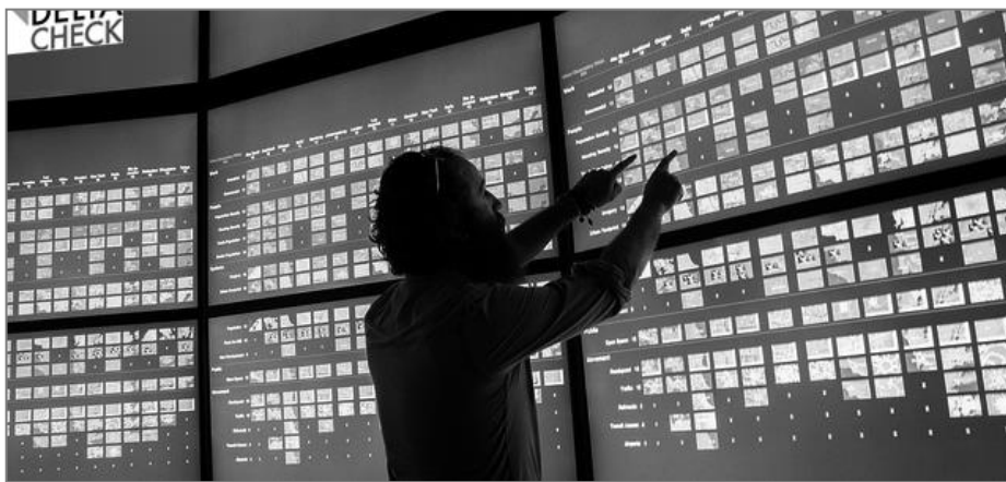
DELTA CHECK Operations Center: Weltweit vernetzt.

35 Millionen Datensätze müssen täglich verwaltet werden. Das heißt: Tägliche Aktualisierung, Korrektur, Selektion und Anreicherung.