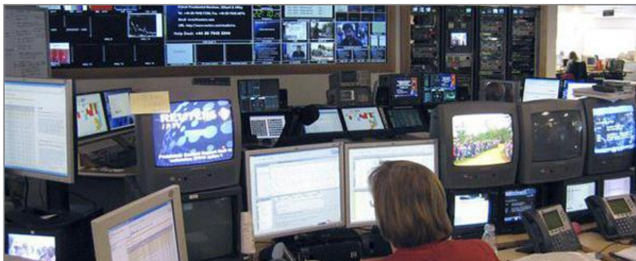
Chief-Editor: Jederzeit alles im Blick.

Damit das bezahlbar bleibt, haben wir hocheffektive Prozesse entwickelt, die entsprechende Leistungen jederzeit sicher zur Verfügung stellen. Zentrale Bestandteile sind: Höchstmöglicher Automatisierungsgrad sowie der Einsatz modernster Crawler-Technologie.